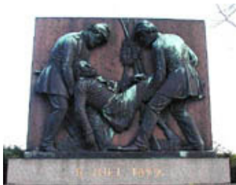
Krigsgraven i Fredericia

Frit efter bogen: "1849 Og de faldnes minde" af A.D.Cohen