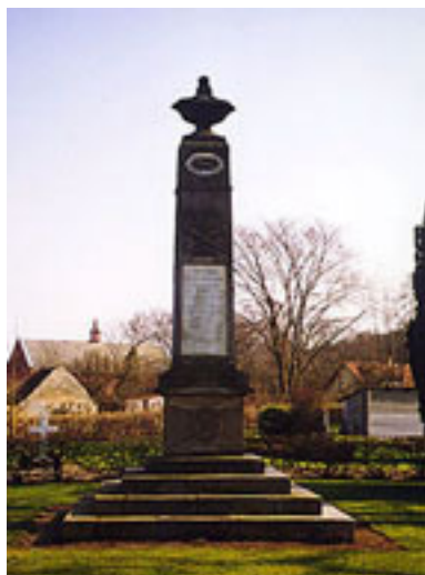
Mindesten på Assens kirkegård